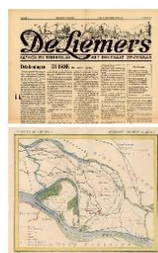
Kranten - Kaarten