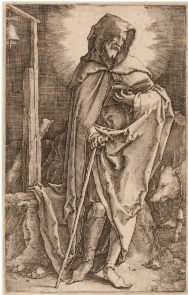
Heilige Antonius Abt, gravure door Lucas van Leyden, 1521, coll. Teylersmuseum, Haarlem