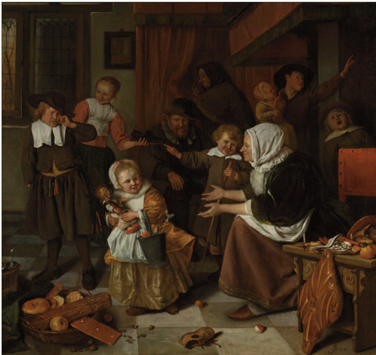
Het Sint-Nicolaasfeest, Jan Havicksz. Steen, 1665-1668, collectie Rijksmuseum, Amsterdam