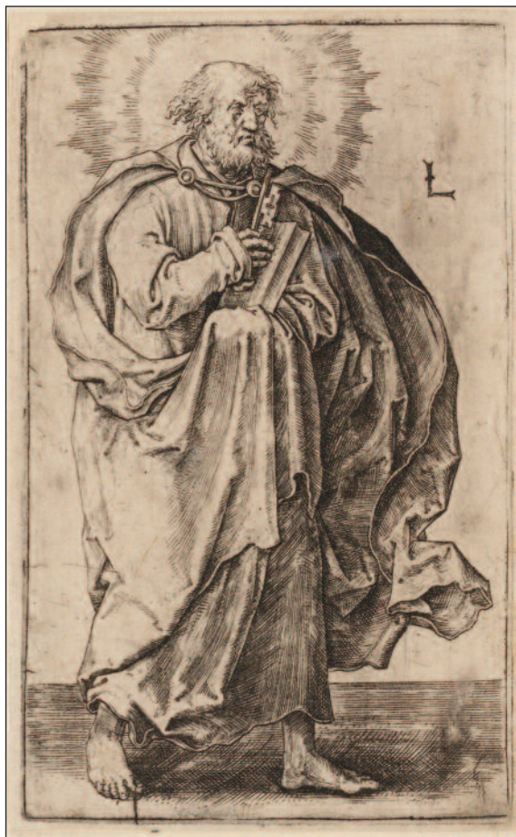
Heilige Petrus, kopergravure omstreeks 1511, door Lucas van Leyden (1494-1533), collectie: Teylers Museum Haarlem