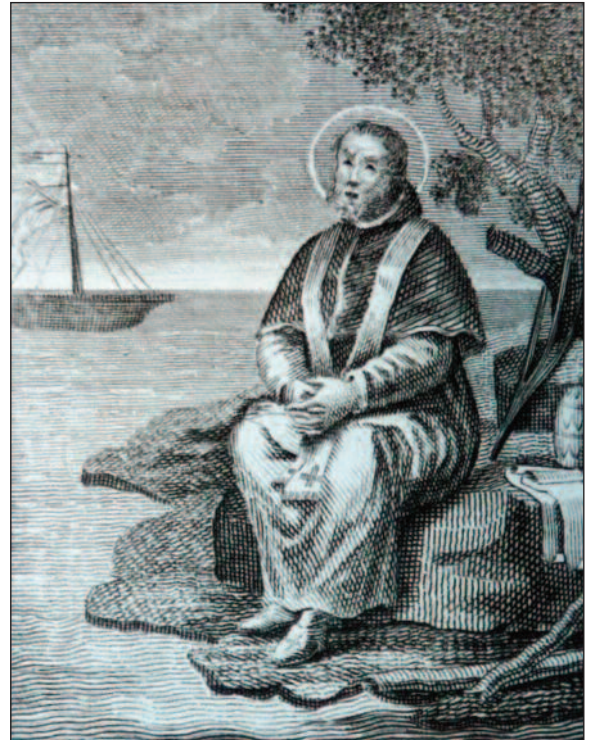
Heilige Pontianus, staalgravure 18e eeuw, anoniem.