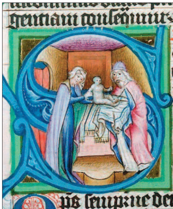
Maria Lichtmis (Purificatio Mariae), boekillustratie uit het begin van de 15e eeuw, collectie Bibliotheek Stift Klosterneuburg te Klosterneuburg (Oostenrijk).