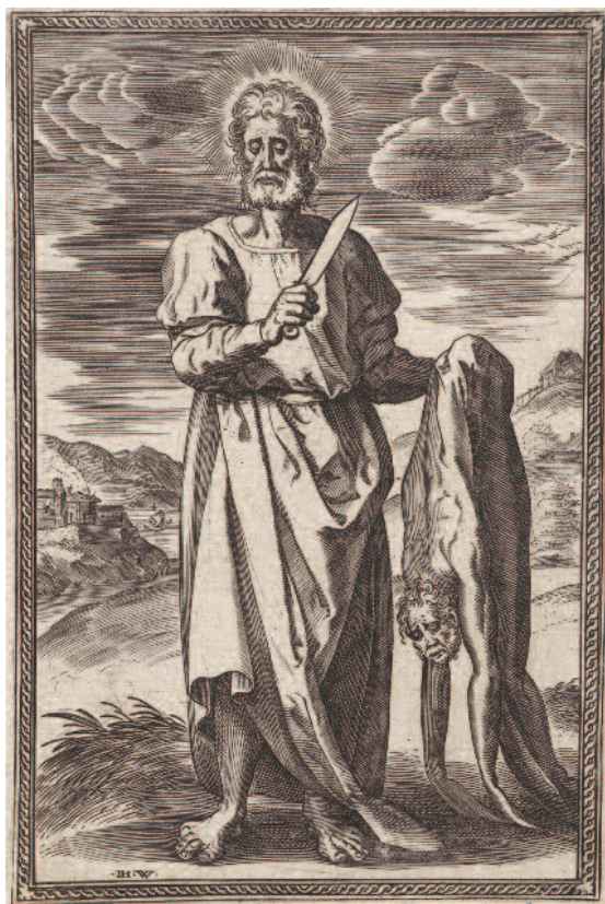
Bartholomeüs, gravure Johannes Wierix, 1559-1585, collectie Rijksprentenkabinet, Amsterdam.