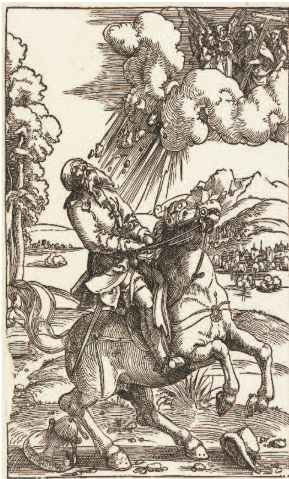
Bekering van Paulus - Hans Baldung Grien (1505-1507), houtsnede.