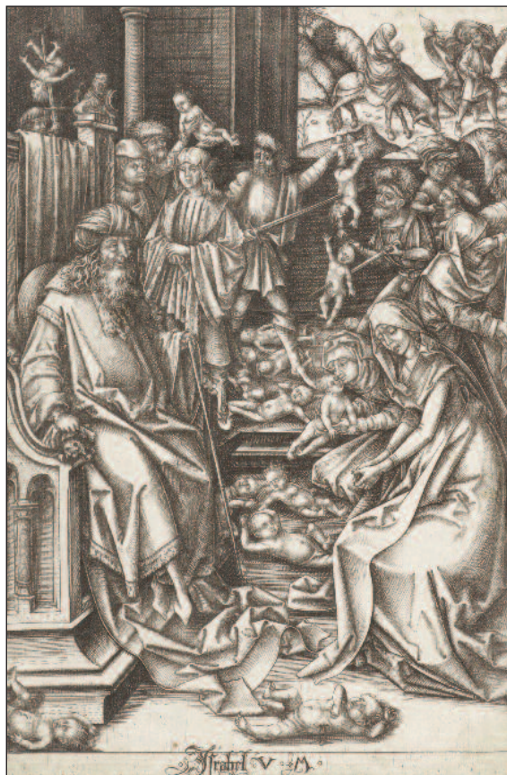
Onnozele Kinderen (Allerkynderdag). Kindermoord te Bethlehem, kopergravure door Israel van Meckenem, 1455. Collectie Rijksprentenkabinet, Amsterdam.