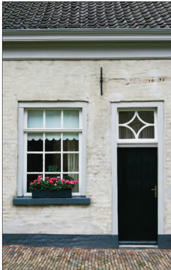
Een van de oude gasthuishuisjes, gebouwd in 1578 (2015).