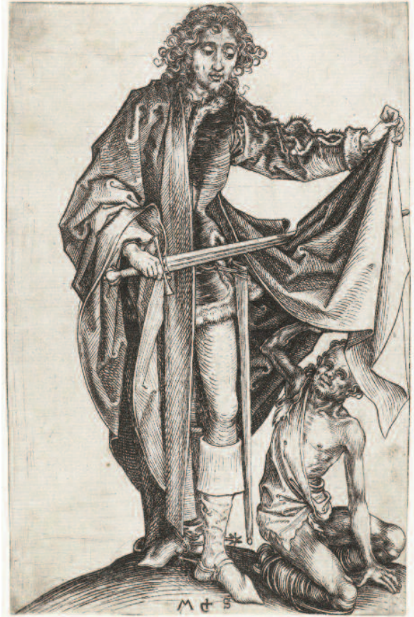
Sint Maarten, gravure door Martin Schongauer, 1470-1490.