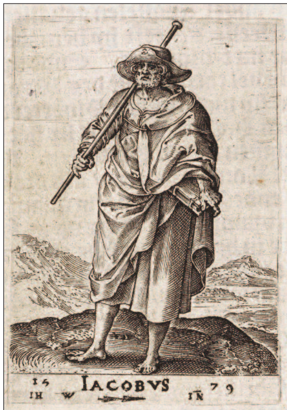
H. Jakobus, Johannes Wierix, 1579, gravure. Collectie Rijksprentenkabinet, Amsterdam.