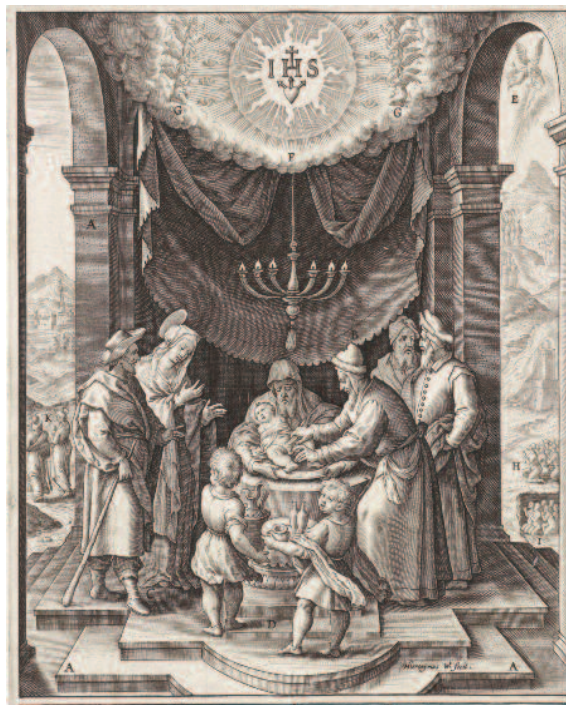
Besnijdenis van Christus (Circumcisio Domini) , door Hieronymus Wierix, 1593, collectie Teylers Museum, Haarlem.